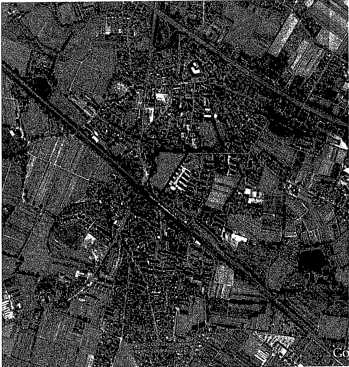
Abbildung 1: Lage der Brandtschen Wiese im Ortskern von Halstenbek

Die Brandtsche Wiese stellt mit rund 20.000 m 2 Größe die umfangreichste zentrale Grünfläche in Halstenbek dar (Abbildung 1). Aufgrund der Lage und Strukturierung dieses Bereichs ist aus artenschutzrechtlicher Sicht nicht damit zu rechnen, dass bedeutende Fortpflanzungs- und Ruhestätten europäisch geschützter Arten durch die Planung betroffen sind, sofern die derzeit bestehenden Gehölzbestände an der Westgrenze und im Süzipfel des Planungsraumes erhalten werden. Für Amphibien fehlen dann auf der überplanten